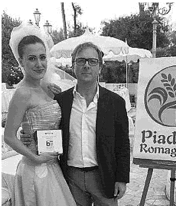
Matrimonio Tra la Piadina e Mortadella di Bologna

La partecipazione del Consorzio di Promozione della Piadina Romagnola, fa seguito a quella della Notte Rosa che ha visto il matrimonio tra la Piadina Romagnola e la Mortadella di Bologna Igp con oltre 4mila assaggi serviti in piazzale Fellini a Rimini nel giorno della grande kermesse. Madrina della serata la "Sposa Perfetta", la simpatica sposina "mortadelloso" testimonial dell'incontro Mortadella-Piadina al Grand Hotel di Rimini nella cerimonia di inaugurazione della Notte Rosa. Così dopo le polemiche questa volta la piadina romagnola metterà finalmente d'accordo tutti.