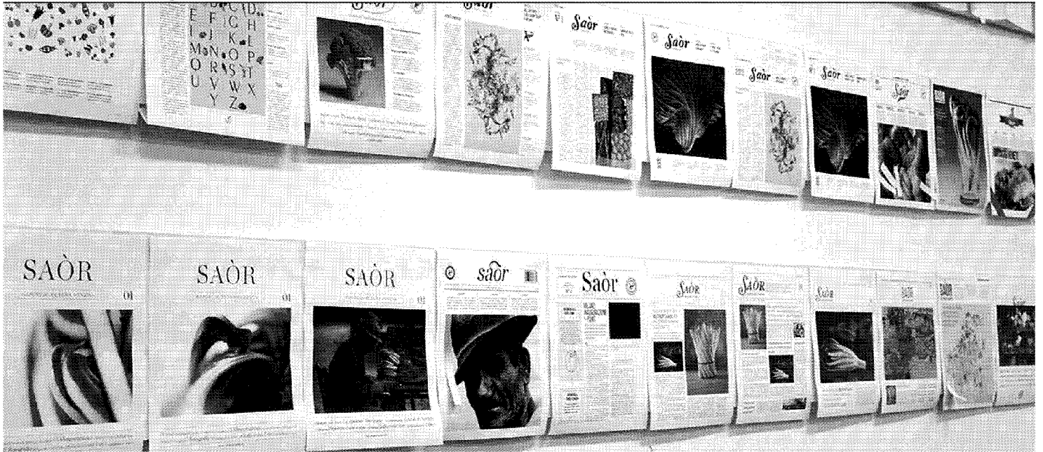
La sequenza di immagini create per la mostra "Design dalla terra alla tavola" che sarà inaugurata stasera nel chiostro dell'ex convento di Santa Margherita sede dell'Archivio di Stato con i risultati di quattro laboratori di progetto