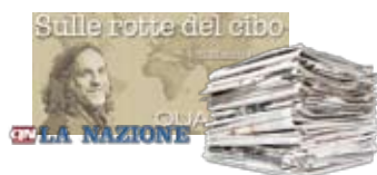
Sulle rotte del cibo - La Nazione