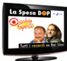
La Spesa DOP - Rai Uno