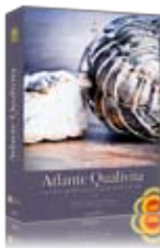
Atlante Qualivita 2011