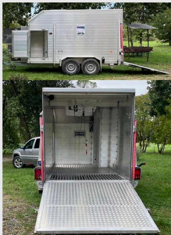
Figura 2. Trailer impiegato nella prova.

Qualità delle carni: il pH delle carni a 48 ore dalla macellazione è risultato mediamente più basso negli animali macellati in azienda. Questo andamento, in associazione con il quadro pre-macellazione descritto sopra, può indicare un metabolismo muscolare post-mortem più favorevole, potenzialmente collegato a una migliore qualità della carne. Non sono emerse differenze significative negli altri parametri tecnologici (colore, capacità di ritenzione idrica),