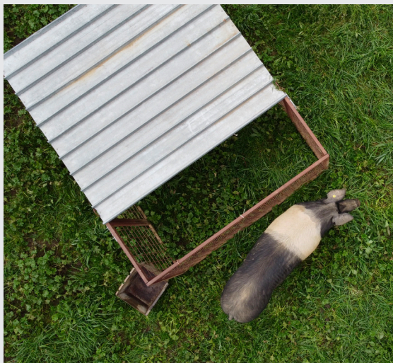
Figura 1. Scrofa di razza Cinta senese allevata in modo estensivo alla Tenuta di Paganico.

Sperimentale del Lazio e della Toscana. L'obiettivo era verificare se la macellazione in azienda potesse rappresentare una soluzione innovativa per ridurre lo stress degli animali e, al contempo, garantire qualità e sicurezza delle carni.