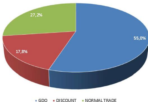
VENDITE ITALIA MORTADELLA BOLOGNA IGP - senza intercompany

Molto positivo il versante export , che rappresenta circa il 25% delle vendite totali e che, con l'aumento a due cifre, pari a +12,4% si conferma un fattore trainante della crescita della IGP.