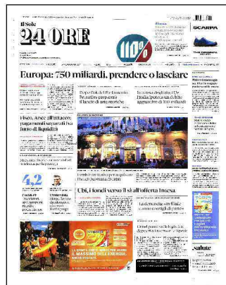
Effetto Covid. Duro colpo per la filiera che ha perso il 25% di fatturato